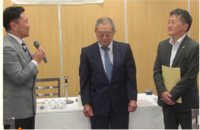
島津スポンサーよりライオンバッジの装着