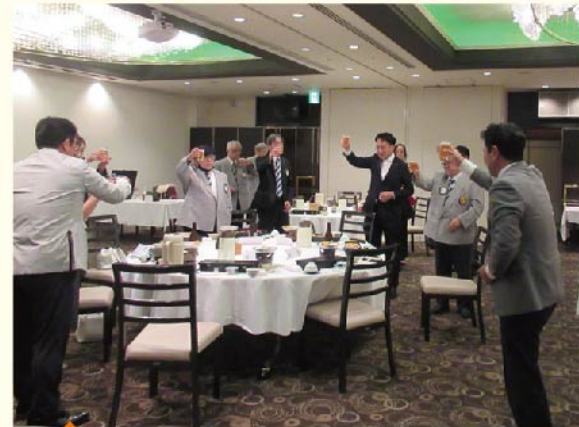
政岡スポンサーよりスポンサー宣言