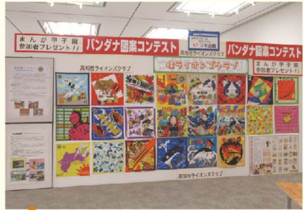
バンダナ500枚、贈呈しました。