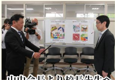
山中会長より校長先生へ 感謝状贈呈。