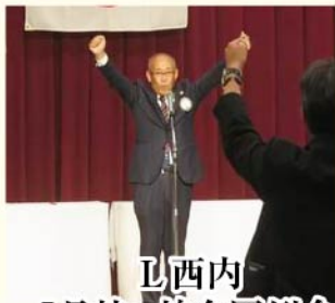
西内 5月桂・柏合同例会