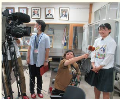
ライオンズローア!!

沢山の報道の方々が 取材してくださいました。 当日、夕方のニュースで 放映され、翌日の 朝刊に掲載されました。