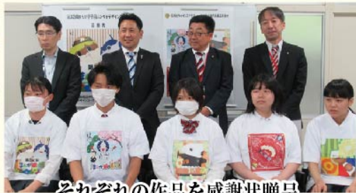
それぞれの作品を感謝状贈呈。 プリントしたTシャツを着てハイチーズ!